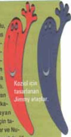
Koziol için tasarlanan Jimmy atalar.