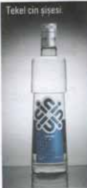
Tekel cin şişesi.

ODTÜ Endüstri Ürünleri Tasarımı bölümünden mezun olduktan sonra yüksek lisansını ODTÜ Mimarlık Fakültesinde tamamlayan Gamze Güven, 1990 yılından beri ürün tasarımı alanında serbest olarak yaptığı çalışmalarını son 7 yıldır şirketi Tasarım Üssü'nde sürdürüyor. Birçok ulusal ve uluslararası endüstri kuruluşuna tasarım hizmeti ve danışmanlığı yapan Güven'in ulusal ve uluslararası 48 tasarım ödülü bulunuyor. Endüstriyel tasarım ödülleri bulunan Güven, Endüstriyel Tasarımcılar Meslek Kuruluşunda çeşitli dönemlerde yönetim kurullarında aktif görev aldı. Ayrıca NTV'de yayınlanmış tasarım programının endüstriyel tasarım kısmının içeriğini hazırlayıp sunan Gamze Güven, Bilgi Üniversitesi Tasarım Kültürü ve Yönetimi Sertifika programında da yan zamanlı olarak eğitimlik görevini sürdürüyor. Tasarımcı sergiye Tekel cin ve votka şişesi, ayrıca raki bardağı tasarımlarıyla katıldı.