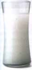
Istanbul serisi raki bardağı.